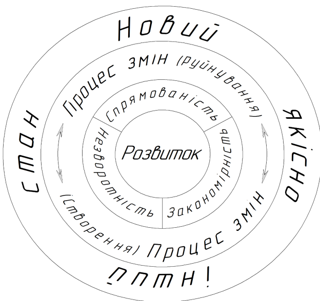
Рис. 1. Концентрична модель структури терміну «розвиток» соціально-економічної системи

Разом з тим інтеграція розвитку і безпекової діяльності в один процес, завдяки якому відбуваються впорядковані, спрямовані, закономірні та незворотні зміни, що забезпечують