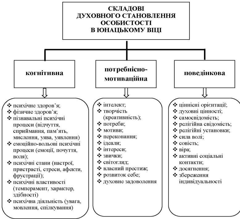
Рис. 2. Авторська модель духовного становлення особистості в юнацькому віці