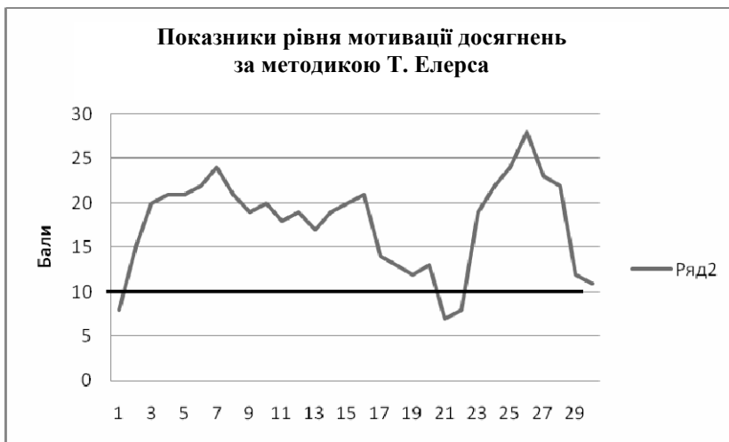
Рис. 2. Мотивація досягнення успіху за методикою Т. Елерса

Серед досліджуваних помітне домінування дуже високого та високого рівня мотивації успіху (див. рис. 2). Середній показник рівня мотивації досягнень у експериментальній групі – 17,7, що відповідає помірно високому рівню мотивації до успіху.