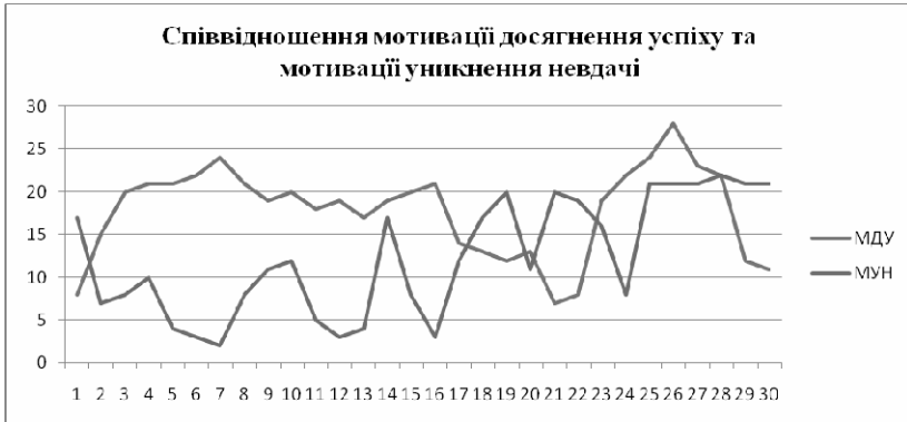
Рис. 4. Співвідношення мотивації досягнення успіху та мотивації уникнення невдачі

До факторів, що впливають на мотивацію досягнення, належать статус, прагнення до досконалості, оптимальне співвідношення заохочень і покарань, правильно поставлені цілі, установка на досягнення, честюлюбство в його позитивному значенні, сприятливий соціально-психологічний клімат, усвідомлення своєї корисності, спільне прийняття рішень, прийняття рішень стосовно відпочинку, робочого графіка повинні узгоджуватися та оптимізуватись відповідно до запитів фірми.