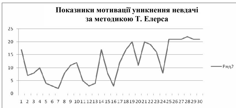
Рис. 3. Показники мотивації уникнення невдачі за методикою Т. Елерса

Середній показник у досліджуваній групі мотивації уникнення невдачі 12,4 бали, що відповідає середньому рівню уникнення невдачі. Показники за кожним членом вибірки зобразимо графічно. Мінімальним показником мотивації уникнення невдачі є 2 бали, а максимальним – 22 бали.