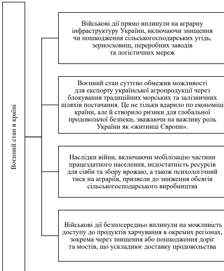
Рис. 2. Основні виклики воєнного часу для системи забезпечення продовольчої безпеки України

спричинених геополітичними конфліктами, зміною клімату та іншими глобальними проблемами. Така диверсифікація джерел постачання має важливе значення для підтримки стабільної наявності продовольства на міжнародному ринку та запобігання кризам, які можуть виникнути через залежність від обмеженої кількості регіонів-виробників продовольства. Крім того, зусилля України з модернізації сільськогосподарського сектору та вдосконалення методів сталого ведення сільського господарства, що продовжуються, сприяють довгостроковій надійності та ефективності виробництва продуктів харчування. Отже, навіть в умовах воєнного стану, сільськогосподарський сектор України залиша-