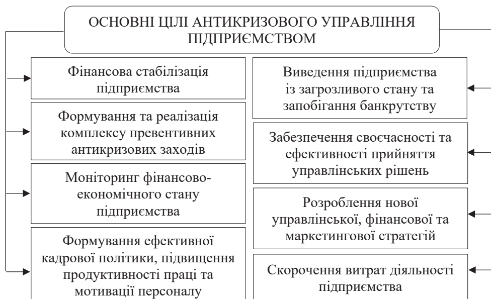
Рис. 1. Основні цілі антикризового управління підприємством в умовах війни та євроінтеграції