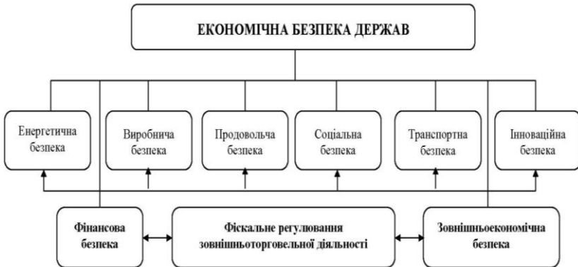
Рис. 3. Місце фіскального регулювання зовнішньоторговельної діяльності у системі ЕКБ держави

Крім неї в це багатоаспектне поняття входять геополітична, військова, інформаційна, екологічна та демографічна безпека. Своєю чергою, ЕКБ відображає причинно-наслідкові зв'язки між економічною могутністю країни, її військово-економічним потенціалом та національною безпекою і має власну структуру. На рисунку 3 відображено авторське бачення місця фіскального регулювання ЗТД у структурі ЕКБ держави.