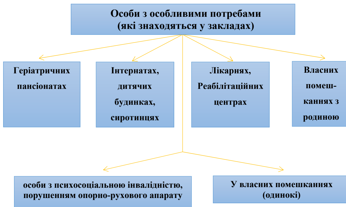
Рис. 2. Структура закладів проживання для осіб з особливими потребами

Таким чином, підсумовуючи вище викладене зауважимо, що особливої уваги потребує напрацювання безпекових алгоритмів дій у надзвичайних ситуаціях, вплив школи, батьків, опікунів за таких умов, зокрема проведення евакуації, комунікації, добору стратегії взаємодії педагогів та осіб з особливими потребами, зокрема із тими, які отримали посттравматичні стресові розлади, тощо.