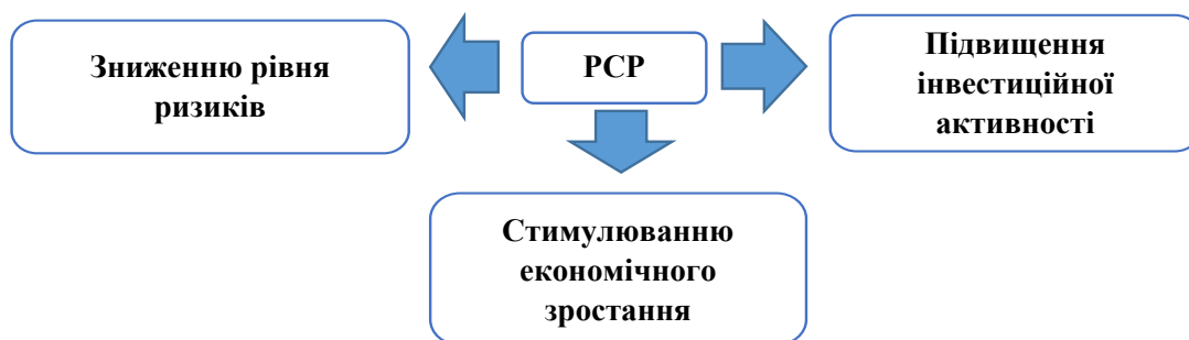
Рис. 2. Роль страхового ринку

Висновки. Проведені дослідження дають можливість зробити наступні висновки, що страховий ринок є суттєвим компонентом економічної безпеки країни і його розвиток сприяє зниженню ризиків у суспільстві, підвищує інвестиційну активність та стимулює економічний ріст. Державна підтримка та регулювання є необхідними для ефективного функціонування страхового ринку. Взаємозв'язок між економічною безпекою та функціонуванням страхового ринку є важливою складовою економічної стійкості та стабільності суспільства. Розроблені у статті теоретичні підходи до оцінки впливу розвитку страхового ринку на економічну безпеку країни можуть бути використані для подальших досліджень та розробки стратегій розвитку страхового сектору. Таким чином проведений комплексний аналіз ролі страхового ринку у забезпеченні економічної безпеки країни дозволяє зрозуміти його значення для стабільності та процвітання суспільства.