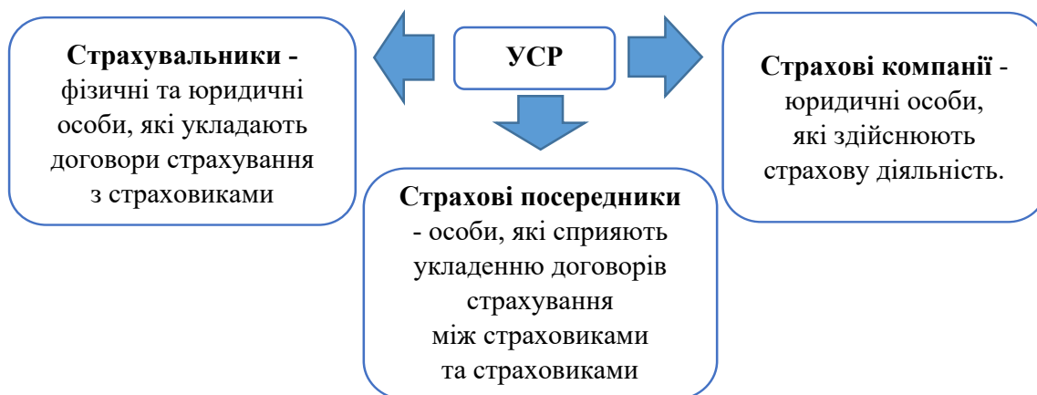
Рис. 1. Головні суб'єкти страхового ринку

Результати. Страховий ринок в сучасних умовах відіграє важливу роль у забезпеченні економічної безпеки як на рівні окремих громадян, так і на рівні підприємств та держави в цілому. Його функції та можливості суттєво розширюються, надаючи надійний захист від непередбачуваних фінансових ризиків та допомагаючи у створенні стійких економічних умов. Страховий ринок – це сфера економічних відносин, де об'єктом купівлі-продажу виступає страховий захист. Страховий захист – це послуга, яка забезпечує страховика компенсацією за збитки, понесені страхувальником в результаті настання страхового випадку. Основними учасниками страхового ринку є (рис. 1):