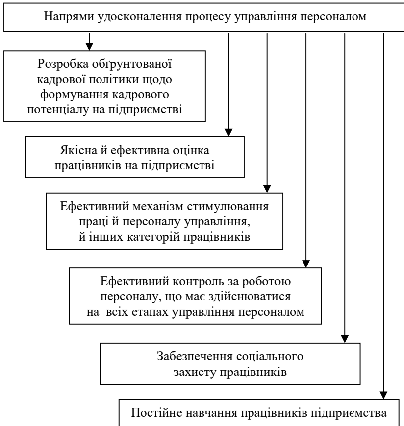
Рис. 1. Напрями удосконалення процесу управління персоналом на підприємстві «Друк»

налу та забезпечать вищі результативні показники функціонування підприємства загалом. До таких заходів доцільно віднести: розробку обґрунтованої кадрової політики в напрямі формування кадрового потенціалу на підприємстві; якісну й ефективну оцінку працівників на підприємстві; ефективний механізм стимулювання праці й персоналу управління, й інших категорій працівників; ефективний контроль за роботою персоналу, що має здійснюватися на всіх етапах управління персоналом; забезпечення соціального захисту працівників; постійне навчання працівників підприємства (рис. 1).