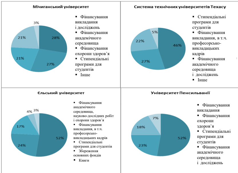
Рис. 2. Структура витрат ендавмент-фондів університетів

Провідні університети світу забезпечують істотну частку знижок, відтермінувань у сплаті за навчання, а також стипендій коштами ендавменту. Також за допомогою ендавмент-фондів навчальні заклади фінансують свої кафедри та адміністративні відділи, надають стипендії та фінансову підтримку викладачам і дослідникам, фінансують інновації. Завдяки надходженням з ендавменту популярні світові університети отримують можливості для побудови нових наукових лабораторій, проведення високотехнологічних досліджень і розширення своєї діяльності. Структуру витрат ендавмент-фондів провідних університетів США наведено на рис. 2.