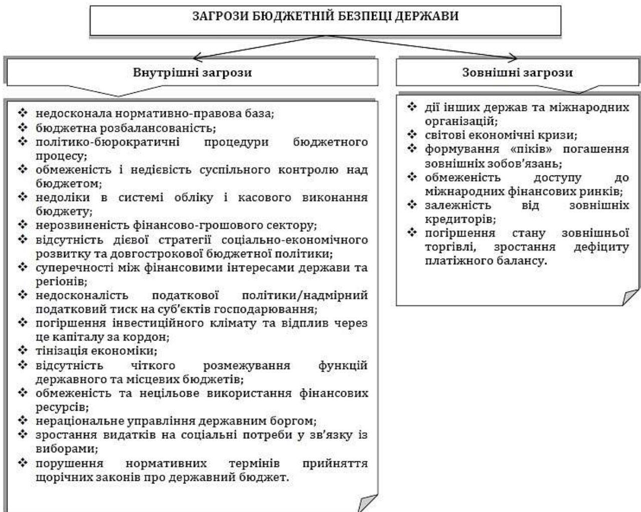
Рис. 2. Джерела загроз бюджетній безпеці України

Отже, бюджетна безпека є гарантом суверенітету, необхідна передумова стійкого соціально-економічного розвитку, ефективності виконання функцій держави та пріоритетною компонентою її фінансової безпеки [8].